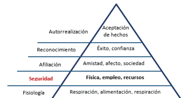
Figura 1 Pirámide de Maslow

Nota. El gráfico representa el ascenso de las necesidades humanas, cumpliendo cada una para subir a la siguiente. Adaptado de Las 5 fases de la pirámide de Maslow, por Instituto Europeo de Postgrado, 2011, https://www.iep.edu .