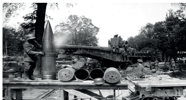
Figura 3 Desarrollo tecnológico- Langer Max

Nota. Munición de 38 cm SK L/45 del “Langer Max” rápida arma de fuego ferrocarril, tecnología utilizada en la Primera Guerra Mundial, 1918. http://obesia.com/index.php/fotografia/historia/guerra