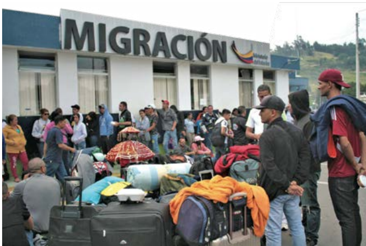
Migrantes venezolanos en la frontera colombo - ecuatoriana.

Ante el ingreso masivo de inmigrantes venezolanos en agosto de 2018, “el Gobierno de Ecuador ha declarado estado de emergencia (no estado de excepción) relacionado con la movilidad humana en las provincias de Carchi, Pichincha y El Oro, para prestar atención urgente a los inmigrantes venezolanos en la frontera norte”, para prestar, con ayuda de entidades de la ONU una “urgente atención a los flujos migratorios inusuales de venezolanos” por la frontera norte que en inicios de agosto de 2018 llegó a 4.200 ingresos diarios (MREMH, 2018). Este accionar del Estado permitirá establecer los planes de contingencia y los mecanismos necesarios para la atención humanitaria en cooperación con las organizaciones del sistema de la ONU.