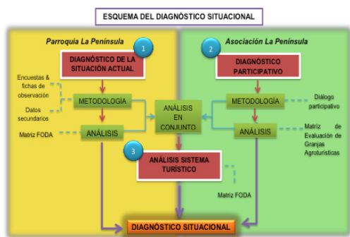
Figura 1. Esquema del proceso de estructuración del diagnóstico situacional