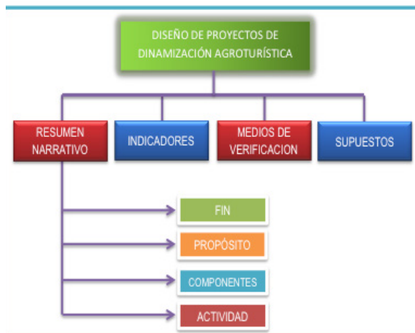
Figura 5. Estructura de los proyectos de dinamización agroturística

La formulación de los proyectos se plantearon en relación a las necesidades y resultados que se obtuvieron en el diagnóstico situacional de los socios de la Asociación de Productores Agrícolas La Península, utilizando para aquello la metodología de Marco Lógico, planteándose 17 actividades, mismas que establecen un plazo de 11 meses para su desarrollo, además de incluir su nivel de priorización, determinándose un costo total de $1050.00. Se consideró que los proyectos pueden ser encaminados a través de fuentes de apoyo y financiamiento de entidades como el Gobierno Provincial de Tungurahua, el Gobierno Autónomo Descentralizado Municipalidad de Ambato y las universidades a través de proyectos de vinculación con la comunidad.