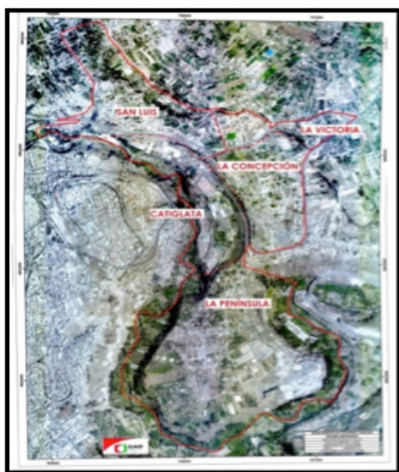
Figura 2. Sectores de la parroquia La Península

Para la realización del diagnóstico de la parroquia se define al territorio en cinco sectores: San Luis, La Victoria, La Concepción, Catiglata y La Península, mismo que pueden ser visualizados en la figura 2.