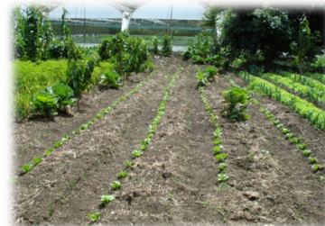
Fotografía N. 5 Cultivos de los socios

El lugar de incidencia del programa de dinamización agroturística se localiza en el sector de La Península perteneciente a la parroquia con el mismo nombre, se encuentra bajo la jurisdicción del cantón Ambato, provincia de Tungurahua. Este sector alberga a los beneficiarios directos de la propuesta, los cuales son socios de la Asociación de Productores Agrícolas La Península, mismos que desarrollan sus actividades agropecuarias en la parroquia, cada uno con variedad de cultivos y especies de animales de granja.