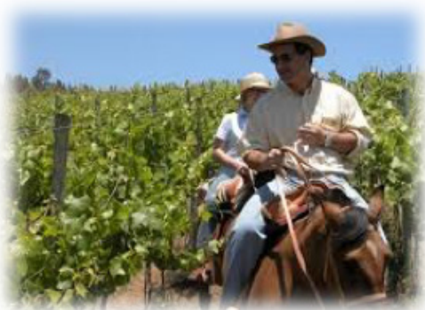
Fotografía N. 2. Agroturismo en la Ruta del Cacao - Guayas

prioritario en el cual interactúan catorce haciendas ubicadas en las provincias del Guayas, Cañar, Los Rios y El Oro, establecimientos considerados pioneros en agroturismo, que buscan entrelazar las tradiciones de agricultura y saberes populares con los servicios y facilidades turísticas que cada cantón ofrece, siendo una alternativa de recreación que impulsa el Ministerio de Turismo y la Empresa Pública Municipal de Turismo y Promoción Cívica de Guayaquil.