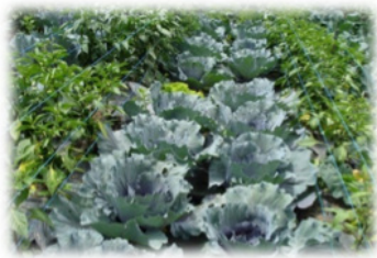
Fotografía N. 6 Cultivos de col en las granjas de los socios