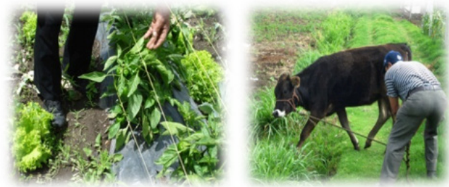
Fotografía N. 3. Actividades agroturísticas en La Península - Ambato

iniciativas locales y en concordancia con la Constitución de la República, por lo que se espera se planteen propuestas que reconozcan los derechos de la naturaleza y las bases para un desarrollo sostenible, entendiéndose que para aquello es necesario interrelacionar a los componentes: económico, social y ambiental. (Ministerio de Turismo del Ecuador 2015)