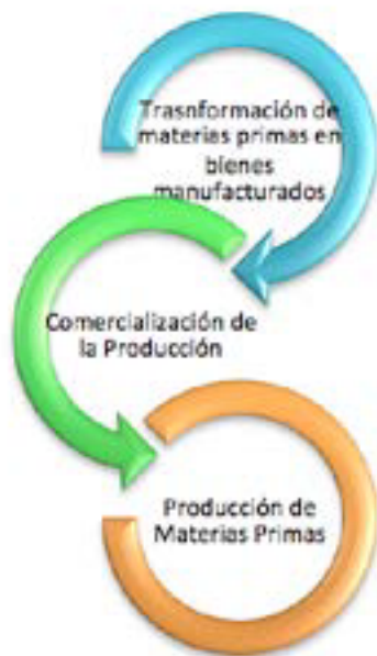
Figura N. 3: Fases del Circuito Productivo

Las fases del circuito productivo mencionadas anteriormente se hallan percibidas desde el punto de vista del IEPS Ecuador.