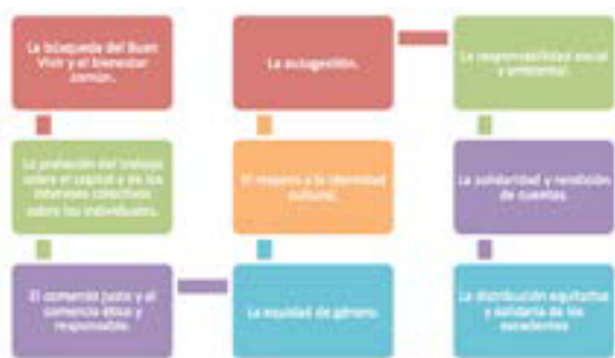
Figura N. 2: Principios de la Economía Popular y Solidaria

Sin embargo, Ecuador ha determinado por medio de la citada ley los principios sobre los cuales se funda esta economía, se muestra en la Figura N. 2, el Art. 4, que menciona, “Las personas y organizaciones amparadas por esta ley, en el ejercicio de sus actividades, se guiarán por los siguientes principios, según corresponda”.