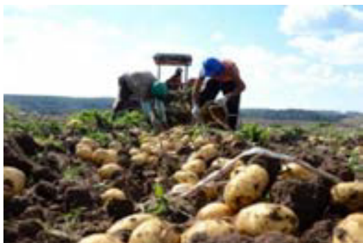
Fotografía N.1: Primera etapa del circuito productivo de la papa.

Se recalca que a nivel global estos se encuentran inclinados más hacia el desarrollo de la agroindustria. En tal sentido, Steimberg, J. (2012) menciona que los circuitos productivos en cuanto a alimentación se relacionan directamente con ella, debido a que es un sistema dinámico que implica la combinación de dos procesos, el agrícola y el industrial, con el objetivo de transformar los productos provenientes del campo. Está integrada por etapas que se van articulando: la fase de producción agrícola, el transporte de las materias primas hasta las fábricas para su procesamiento y la comercialización nacional e internacional, es decir, todo el trayecto que recorren los productos del campo hasta llegar al consumidor.