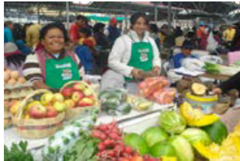
Fotografía N.3: Comerciantes de las Ferias Ciudadanas

Y es que en estas ferias uno encuentra de todo, productos agrícolas, golosinas, condimentos naturales y otros de consumo general, bebidas, y hasta ropa. Son emprendimientos asociativos, son hombres y mujeres que cada sábado presentan sus cultivos, su arte, su modo de vida. Varias de estas asociaciones se encuentran en lugares estratégicos, la oferta va desde lo clásico hasta la recuperación de productos endémicos en peligro y su revalorización. Las ferias ciudadanas incentivan la agricultura comunitaria, los huertos familiares y el desarrollo de capacidades técnicas.