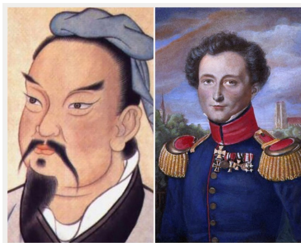
Figura 2 Pensadores Estratégicos