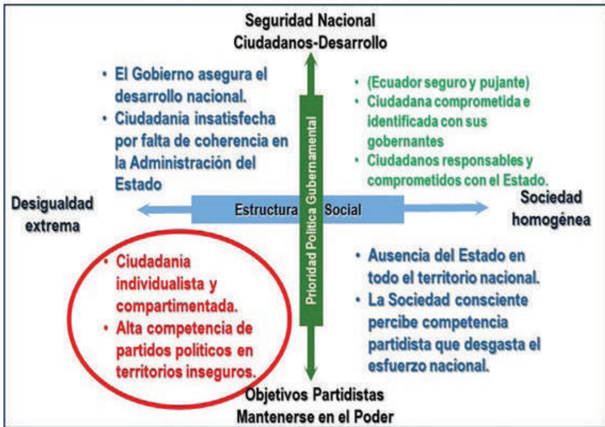
Matriz de los Impulsores B y C

Una vez teniendo a la vista los escenarios posibles, se analizan desde la mirada de la Seguridad Integral y se infieren aquellos escenarios de preocupación por la implicancias negativas para el Estado, como se puede apreciar en figura 6.