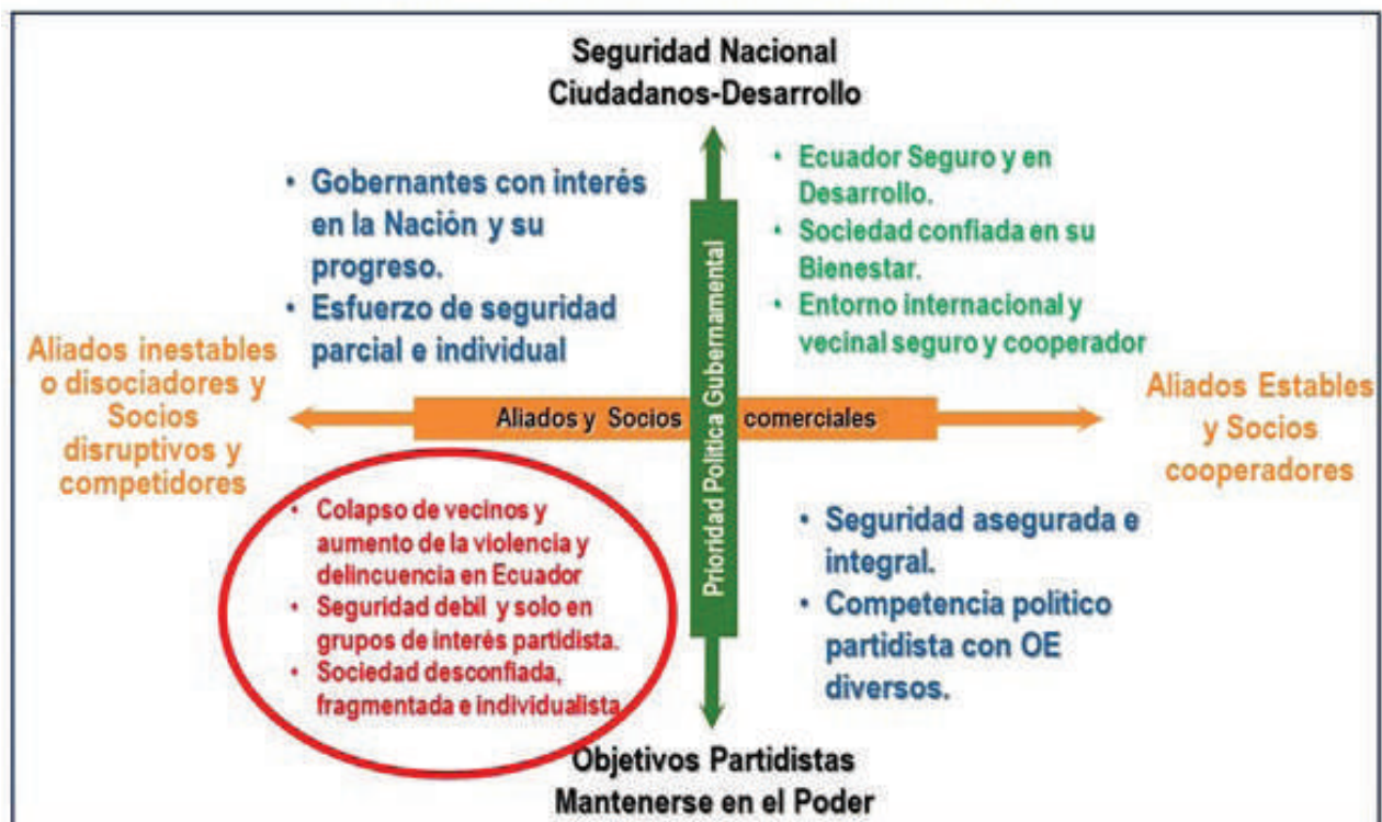
Matriz de los Impulsores A y C