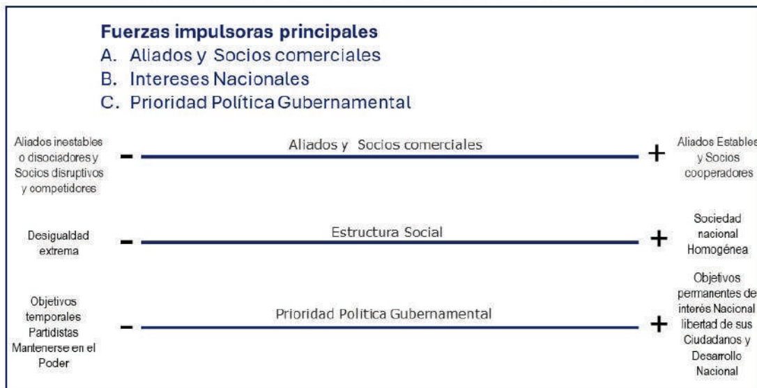
Espectro de las Fuerzas Impulsoras Principales