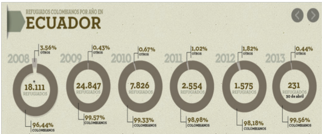
Gráfico 2, Refugiados colombianos por Año 2008-2013. Fuente: Dirección de Refugio, Ministerio de Relaciones Exteriores y Movilidad Humana del Ecuador, diario El Universo.

El siguiente gráfico muestra la cantidad de refugiados en los últimos seis años.