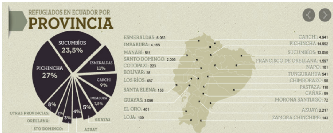
Gráfico 3, Fuente: Dirección de Refugio, Ministerio de Relaciones Exteriores y Movilidad Humana del Ecuador, diario El Universo.

Tal como se evidencia en la imagen anterior, la provincia céntrica de Pichincha concentra la más alta cantidad de número de refugiados colombianos en el Ecuador (14.992), luego le sigue la provincia amazónica fronteriza de Sucumbíos (13.050), que limita con el departamento fronterizo de Putumayo, y en cuyas selvas operarían los frentes 38 y 42 de las FARC. En tercer lugar le sigue la también provincia fronteriza costera de Esmeraldas (6.063) las cual colinda con el departamento colombiano de Nariño, donde operaría el frente 49 de las FARC y se concentraría el mayor número de hectáreas de hoja de coca de toda Colombia. Luego le siguen otras provincias céntricas, cuyos puntos de concentración serían los centros comerciales en ciudades principales, tal es el caso de Imbabura (3.166), Guayas (3.056), Azuay (2.217), Santo Domingo de los Tsachilas (2.006), entre otras.