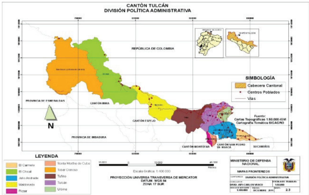
Mapa N° 3. división política administrativa del Cantón Tulcán

El Cantón Tulcán tiene una estructura territorial rectangular, en forma de faja. Esto significa que su longitud es desproporcionada con relación al ancho; en consecuencia esta organización política, por su conformación, presenta una serie de problemas de carácter político, social, administrativo, económico y de defensa. Cada uno de estos componentes tiene su especial particularidad en el área que se analiza, donde es importante considerar la distribución geográfica política de las parroquias rurales que configuran el Cantón Tulcán.