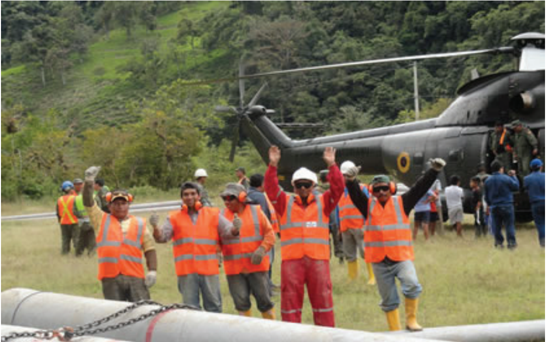
Foto N° 4. Transporte de material para proyecto de electrificación

respiratorio. Como infraestructura de salud disponen de un policlínico, en el que atienden dos médicos generales, un odontólogo, dos enfermeras, un tecnólogo y un chofer para la ambulancia, disponiendo de una botica con insuficiencia de medicinas.