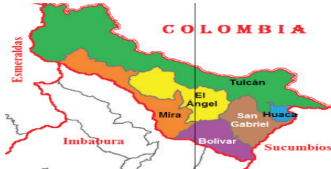
Mapa N° 1. Provincia del Carchi N

que de este a oeste son: Tobar Donoso, Chical, Maldonado, Tufiño, Urbina, Julio Andrade, El Carmelo, Santa Marta de Cuba y Pioter; las dos últimas no están en contacto físico con el Departamento de Nariño.