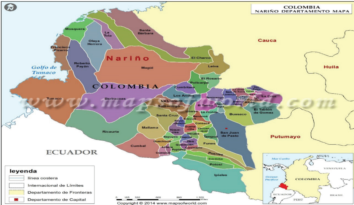
Mapa N° 4. Departamento de Nariño

La forma rectangular es la razón por la que las dos parroquias del extremo occidental han tenido un desarrollo precario; uno, por la falta de vías de comunicación, y dos, por la distancia a la que se encuentran de la región central, donde está ubicada y funciona la estructura político administrativa del cantón y conocida como núcleo vital; (1) la primera Parroquia Rural Tobar Donoso y su recinto Tobar Donoso distantes y sin enlace terrestre; (2) la Parroquia Rural El Chical con su recinto San Marcos, el más apartado y sin enlace vial, y los recintos Peñas Blancas, La