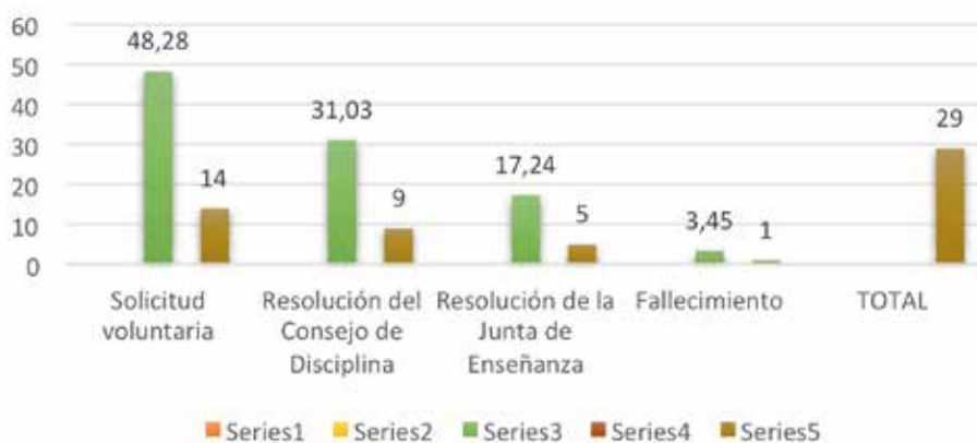
Figura 2. Tipo de Trámite de Bajas. Promoción 2015-2017