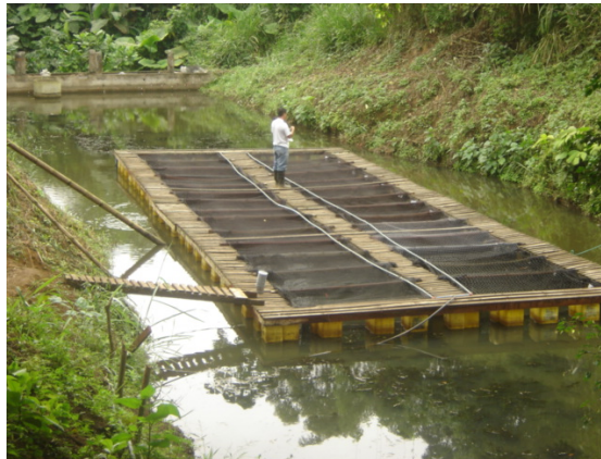
Figura 1. Módulo experimental para cachama, Hda. Zoila Luz, Ecuador, 290 m s.n.m.

El experimento se desarrolló en las instalaciones de la Hacienda Zoila Luz, IASA II - ESPE en la cota de 290 m s.n.m., provincia de Santo de los Tsáchilas, Ecuador. El sistema de cultivo fue constituido en un módulo de jaulas flotantes con 30 unidades experimentales. Cada unidad experimental con una capacidad de 1,2 m 3 . Se mantuvo una renovación total de agua del 100% día -1 . (Fig. 1).