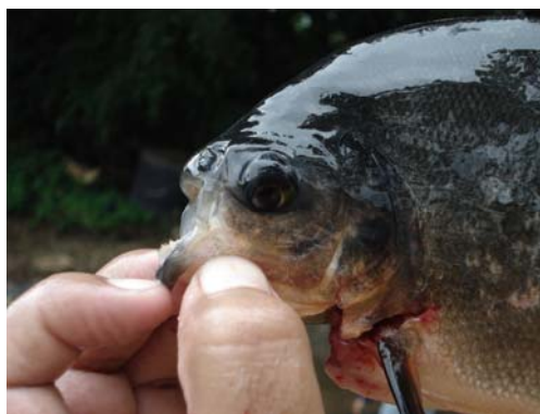
Figura 2. Producto final en base a dietas alimenticias de amaranto.