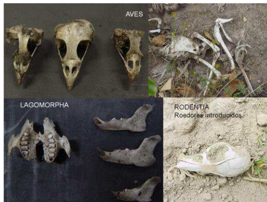
Figura 1. Restos de los vertebrados encontrados en las egagrópilas de la lechuza de campanario ( Tyto alba ) del sector de estudio.

Entre los mamíferos, el 90,6 % corresponden a los roedores de la familia cricetidae y a algunos roedores introducidos. El 5,3 % corresponden a la especie de conejo silvestre ( Sylvilagus brasiliensis ), y se encontraron también restos de aves que corresponden al 4 % de todos los ejemplares encontrados (Fig. 1).