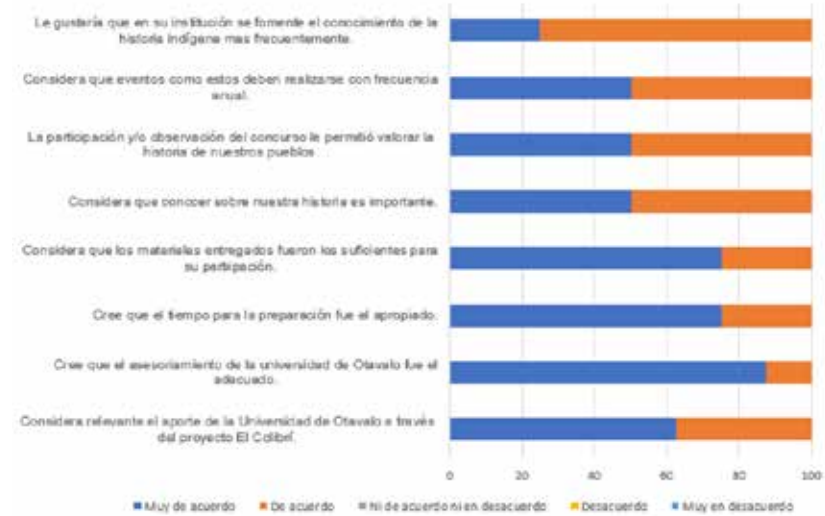
Encuesta de Satisfacción dirigida a estudiantes

Nota. Se describen los resultados de la encuesta de satisfacción a estudiantes participantes en el proyecto.